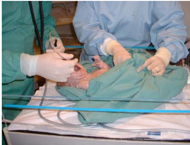
Fig. 4 : Le bébé mis au monde par césarienne se voit infliger de véritables tortures : aspiration des sécrétions pulmonaires (sur l'image), oxygénation artificielle ou encore sondage et prélèvement des sécrétions dans son estomac. Le lien suivant permet d'en réaliser l'ampleur : http://www.perineology.com/mac/premsoins_im1.htm .

Mais de nombreuses enquêtes contredisent cette présomption. D'après un sondage réalisé en Corée du Sud, où le taux de césariennes atteint près de 40 %, plus de 95 % des mères interrogées souhaitent accoucher par les voies naturelles durant leur grossesse et, parmi celles qui subissent une césarienne, seules 10 % déclarèrent l'avoir fait sur demande. Les auteurs concluent que l'augmentation rapide des taux de césarienne doit être imputée aux prestataires de services médicaux et au système de santé dans lequel ils travaillent, mais non à la demande des femmes (44). En Italie, où le taux moyen de césarienne était de 33,2 % en l'an 2000, près de deux mille mères furent interrogées. Parmi celles qui accouchèrent par les voies naturelles, 91 % étaient satisfaites de leur choix et 73 % de celles qui subissent une césarienne auraient préféré une naissance par voie vaginale (45). Des réponses très similaires furent rapportées par une enquête réalisée auprès de femmes brésiliennes ayant accouché dans les hôpitaux publics des villes de Sao Paulo et de Pernambuco, où les taux de césarienne sont particulièrement élevés (46). Ces prises de position mettent en évidence le refus de la corporation médicale de respecter le désir profond des femmes de vivre le moment de l'accouchement et de la naissance avec toute l'intensité qu'elles en pressentent.