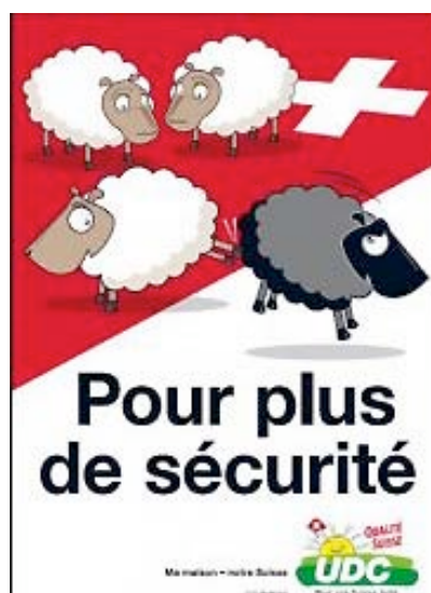
Fig. 6 : La politique prônée par l'UDC à l'encontre des étrangers est une conséquence collective de l'insécurité que vit l'enfant dont les parents humilient constamment la nature au nom de son adaptation au consensus national. (Affiche UDC des élections fédérales du 21.10.07)

Une telle résurgence de souffrances refoulées sur la scène sociale helvétique est particulièrement manifeste si l'on considère le message politique véhiculé par l'UDC lors de ses campagnes contre l'insécurité ou contre l'emprise étrangère. Avant les élections législatives de 1999, une affiche de l'UDC comparait les requérants d'asile à des criminels pénétrant par effraction sur le territoire en lacérant le drapeau suisse, suggérant par un slogan provocateur l'idée qu'il faut s'en protéger comme du sida (45). Celles de 2007 furent illustrées par un dessin représentant trois moutons blancs chassant un mouton noir hors de nos frontières à coups de pied, avec cet argument : « Pour plus de sécurité » (fig. 6). Dans l'intervalle, du fait notamment de la présence de Christoph Blocher au Conseil fédéral depuis janvier 2004, les mesures prises contre les étrangers indésirables se sont considérablement durcies.