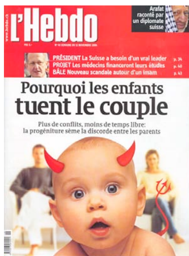
Fig. 3 : Les adultes tiennent leurs enfants pour responsables de leurs propres problèmes et projettent sur lui qu'ils sont habités par un esprit démoniaque. (L'Hebdo No 46, 11.11.04)

yeux un parent exigeant et normatif – le trop fameux « tyran domestique » – qu'ils vivent en victimes. Ils pourront alors se justifier de remettre en scène avec leur bambin les circonstances par lesquelles leurs propres besoins relationnels ont été méprisés dans l'enfance. L'adulte exigera alors de l'enfant qu'il devienne « consensuel » à défaut de l'avoir été en naissant.