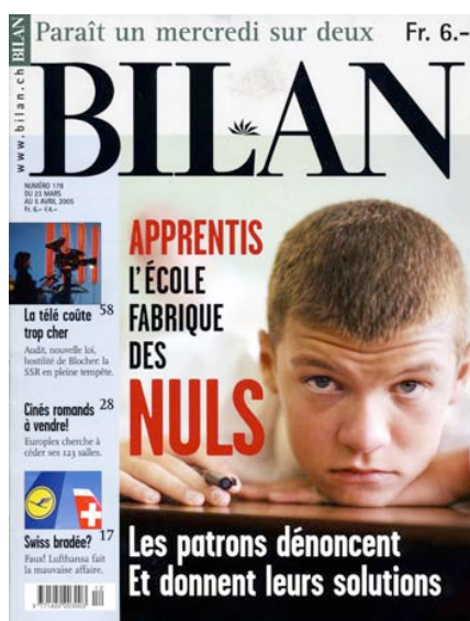
Fig. 4 : En Suisse, la violence psychologique exercée à l'encontre des enfants et des adolescents n'est pas reconnue parce qu'elle constitue un mode d'éducation. (Magazine économique Bilan No 178, 23.3.05)

Or, loin d'être signalée publiquement pour les répercussions pernicieuses qu'elle engendre dans le tissu social, cette forme de violence est largement valorisée sous couvert d'éducation et de formation professionnelle. Ainsi, une récente couverture du bimensuel Bilan , première publication économique romande qui revendique 130'000 lecteurs, présente-t-elle la photographie d'un adolescent hébété accompagné de ce commentaire humiliant : « L'école fabrique des NULS. » (fig. 4) Dans un article consacré à la baisse supposée du niveau de formation des apprentis, les rédacteurs de Bilan font la part belle aux vexations que subissent quotidiennement les jeunes de la part de leurs formateurs et supérieurs hiérarchiques : « Ils ont besoin d'un coup de pied au derrière pour se motiver » ; « Les jeunes sont paresseux et nuls, ils ne pensent qu'aux loisirs » ou encore « Les apprenties vendeuses me font penser aux vaches qui regardent passer les trains ! » (27) Aveuglés par leur détermination à reproduire sur les nouvelles générations les humiliations qu'ils ont eux-mêmes subies, les adultes ne réalisent pas que l'absence de motivation ou d'initiative, le manque de confiance en soi ou encore l'apathie découlent justement de ces violences psychologiques répétées, qui ruinent l'estime de soi et altèrent la capacité de l'enfant à devenir un adulte mûr et responsable.