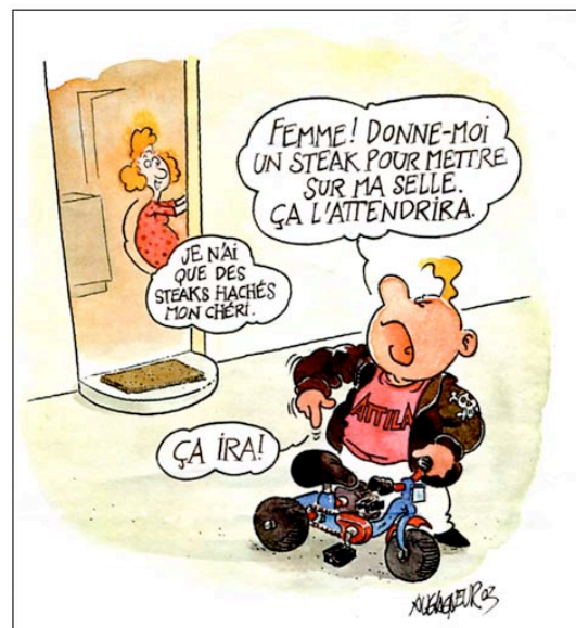
Fig. 1 : Les adultes projettent sur l'enfant les comportements de leurs propres parents envers eux, puis justifient de reproduire sur lui la violence et le mépris qu'ils ont subis. (Construire No 5, 28.1.03)

Le regard que les membres d'un groupe social posent sur les enfants, dès avant leur conception, détermine la manière dont ceux-ci seront considérés par la suite. Il est obscurci par des a priori résultant de la constante gestion que les adultes exercent sur leurs souffrances relationnelles refoulées. En effet, sans la reconnaissance des conditions relationnelles dans lesquelles ils ont eux-mêmes grandi, les parents « saisissent » l'enfant dans la mise en scène de schémas de comportement, héritage de leur entourage familial et social, perpétuant ainsi le déni qui les a fait souffrir. Nombre de spécialistes, relayés par les médias suisses destinés au grand public, insistent par exemple sur l'importance des « frustrations » dans l'action d'éduquer. Ces auteurs trouvent un auditoire captif auprès de la plupart des adultes parce que ces derniers ne veulent pas réaliser à quel point leur vie relationnelle a été dévastée par l'incapacité de leurs propres parents à reconnaître leur nature sensible et consciente, ce qui les aurait amenés à satisfaire pleinement leurs besoins. La compulsion à « frustrer » pareillement leurs enfants devient un moyen de refouler activement les conséquences de ce déni.