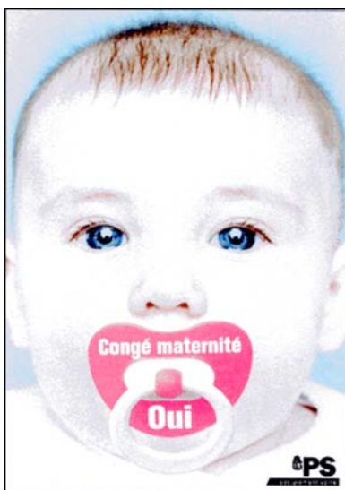
Fig. 5 : En 2004, les marchandages qui entourèrent l'adoption du projet suisse de congé maternité ont montré le mépris des milieux politiques pour les besoins naturels des enfants. (Affiche de votation populaire, 26.9.04)

Aujourd'hui, de nombreuses études démontrent, si besoin est, que les souffrances relationnelles précoces altèrent gravement les facultés naturelles de l'enfant à être en lien avec son environnement social. D'après la psychothérapeute Sue Gerhardt, les nourrissons ne peuvent faire face à une séparation maternelle sans voir leur équilibre émotionnel perturbé : « Les études les plus convaincantes, dit-elle, prouvent que les enfants placés en crèche à temps plein au cours des deux premières années de leur vie ont plus tard des problèmes de comportement. Ils manifestent de l'agressivité à l'égard des autres enfants, sont moins coopératifs et plus intolérants face aux contrariétés. » (37) Ce dont ces enfants ont manqué, c'est de la présence de mères disponibles, qui les allaitent sans retenue, les prennent dans leurs bras et les regardent avec amour. Au lieu de cela, ils furent confiés à des prestataires de services, pour lesquelles ils n'étaient guère que des nourrissons parmi d'autres, et durent refouler l'indicible souffrance de perdre – même temporairement – le lien affectif le plus essentiel.