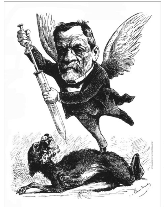
Caricature de Don Quichotte, 1886

Seules des motivations inconscientes peuvent rendre compte d'un tel aveuglement collectif : en l'occurrence, le jeu de l'interdit imposé par le Père sur l'exercice de