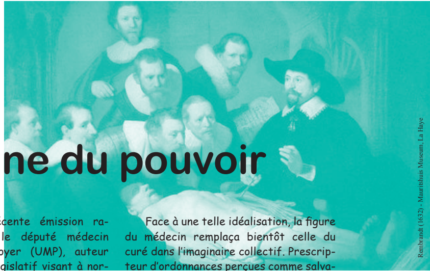
Rembrandt (1632) - Mauritshuis Museum, La Haye