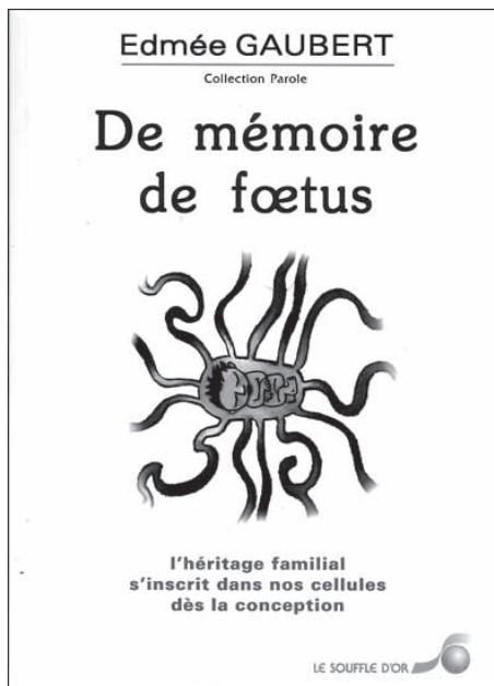
Edmée Gaubert, De mémoire de fœtus , l'héritage familial s'inscrit dans nos cellules dès la conception, éd. Le Souffle d'Or, 2001